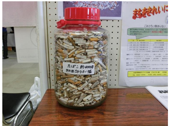
4000本のタバコにびっくり