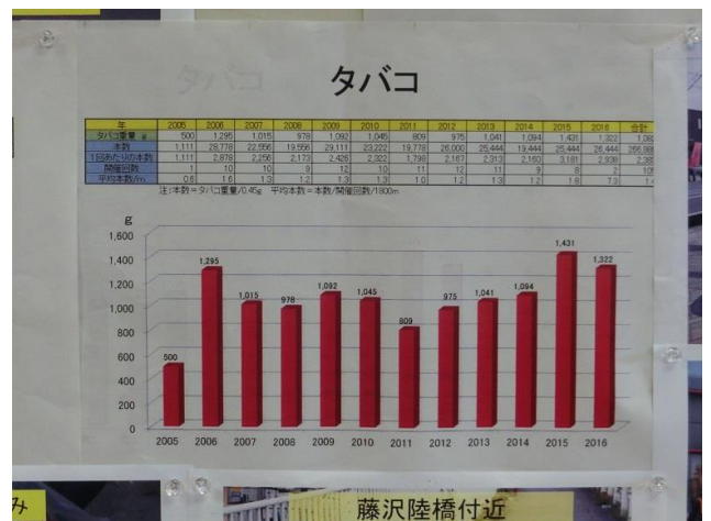
タバコは減少せず