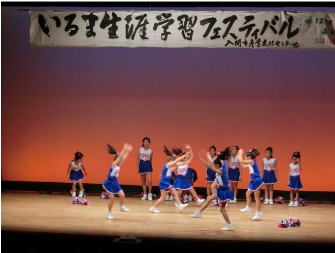
午後まで行われたイベント