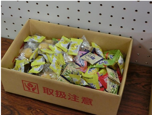
景品として配布のキャンデー