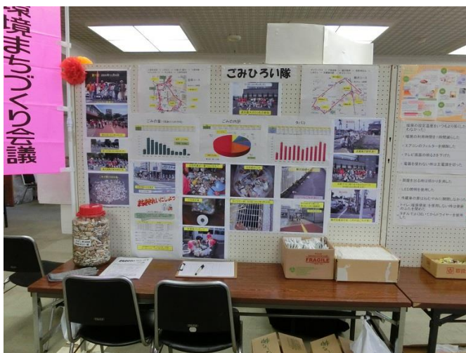
ごみひろい隊の紹介