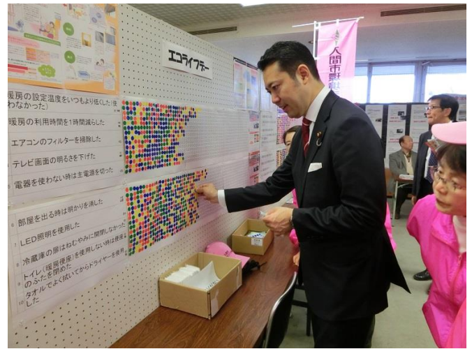
大塚衆議院議員も参加