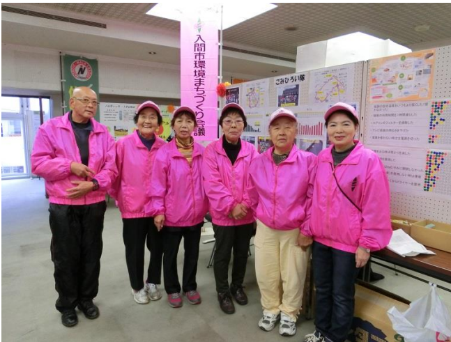
ごみひろい隊のメンバー