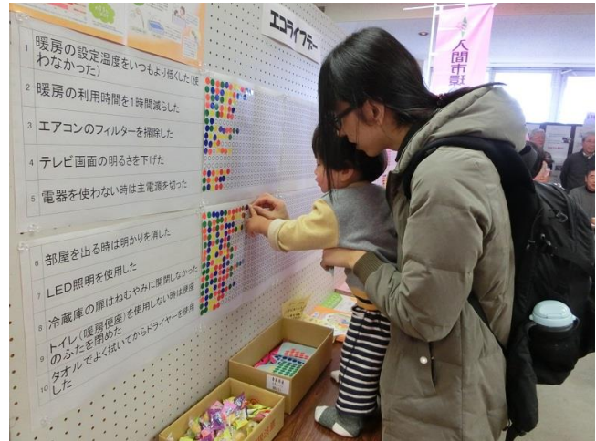
親子で参加の方が多かった