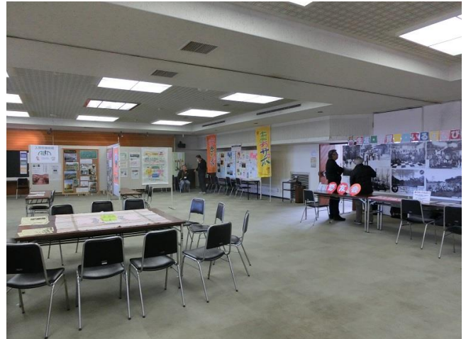
会場は閑散としていた