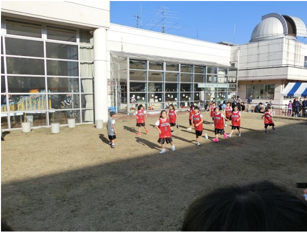
午後まで行われたイベント