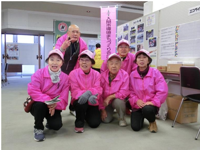
ごみひろい隊のメンバー