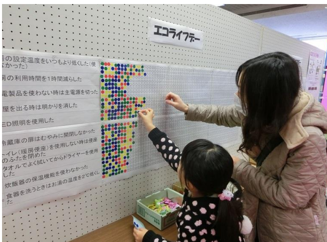
親子での参加の方が多かった