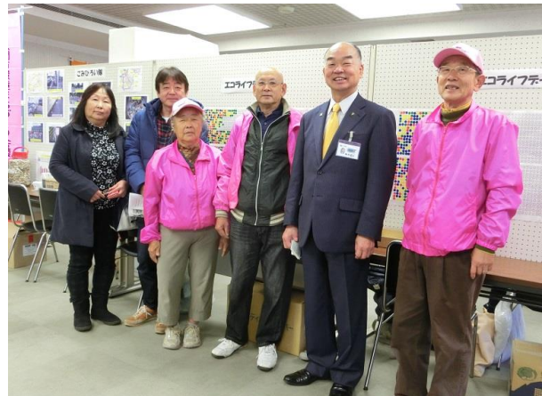
田中市長と一緒に