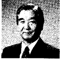
入間市長 木下 博

入間市は、加治丘陵や狭山丘陵などの豊かな自然に恵まれ、文化と産業が調和した活力あるまちとして発展してきましたが、その一方で、私たちの大量消費型の暮らしが、廃棄物の増大や大気汚染、資源・エネルギーの大量使用をもたらし、私たちの未来と地球環境に悪影響を及ぼしています。