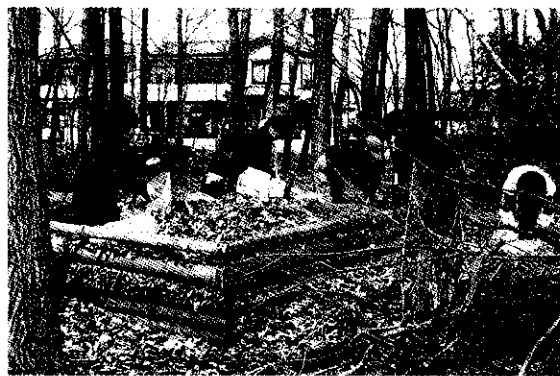
雑木林のなかの落葉入れ

庭の草むしりをしていった時の事です。日影に生えた3cm位の草に、小鳥の羽毛の様な小さな白い毛虫が一匹、張りついていました。彼は、その細い葉を食べ僅かな空気を呼吸し命をつないでいる。何と慎ましい生ノ良い環境は多くの生き物を育むといわれますが、それを保つ為には、つまりこういう虫の生活を認めるという事なのかもしれません。入間市の雑木林は生き物の宝庫。となりのトトロならぬとなりの自然、平地林の保護は意義深いのですが、定期的な作業場所は1カ所だけ。それでも車の進入を防ぐ杭打ちや落葉入れ作り等盛り沢山で、毎回良い汗を流しています。特に落ち葉入れは近所の人とカ